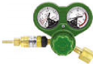
クイックジュニア(酸素用)(E) QJ-OXE