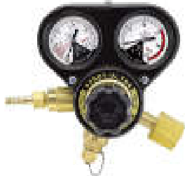
SSボーイウルトラ(酸素用) SSBU-OXE