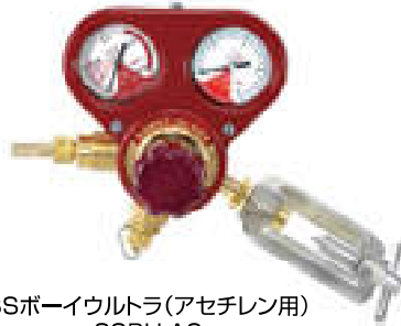
SSボーイウルトラ(アセチレン用) SSBU-AC