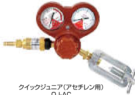
クイックジュニア(アセチレン用) QJ-AC