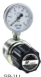
流量計付一般工業用圧力調整器 →P121